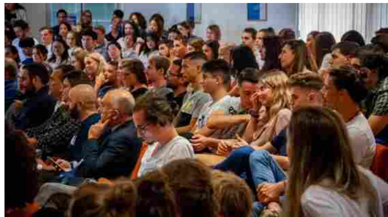
Un gruppo di studenti Erasmus

Aumentano le borse di mobilità internazionale. Sicilia terza in Italia per numero di insegnanti iscritti al programma