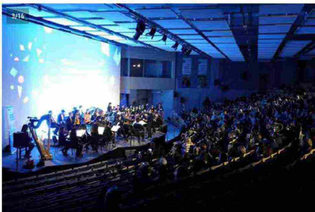
3/16 Bruxelles , l'orchestra Erasmus diretta dal maestro Elio Orciolo suona davanti alla commissione Europea