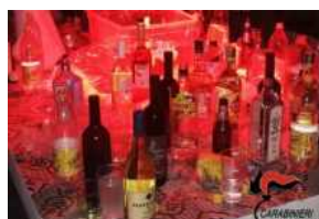
Pantelleria: festa abusiva con