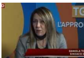
Notti di San Lorenzo e