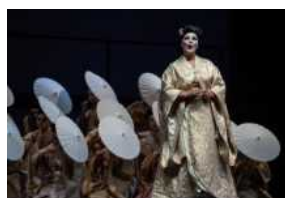
Al Luglio Musicale Trapanese